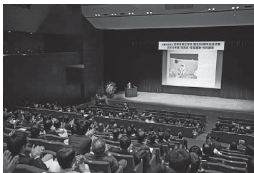
特別記念講演会場にて