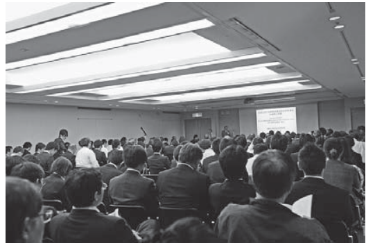
一般講演会場にて