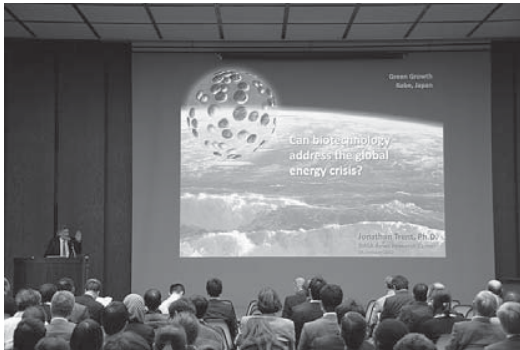
国際シンポジウム講演会場にて