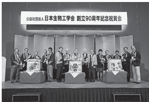
記念祝賀会・鏡割り