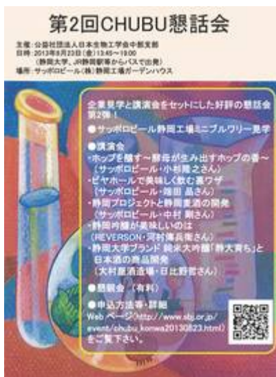
(13:45 静岡大学～JR静岡駅経由のバスにて現地着)