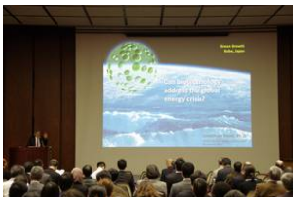
<国際シンポジウム講演会場にて>