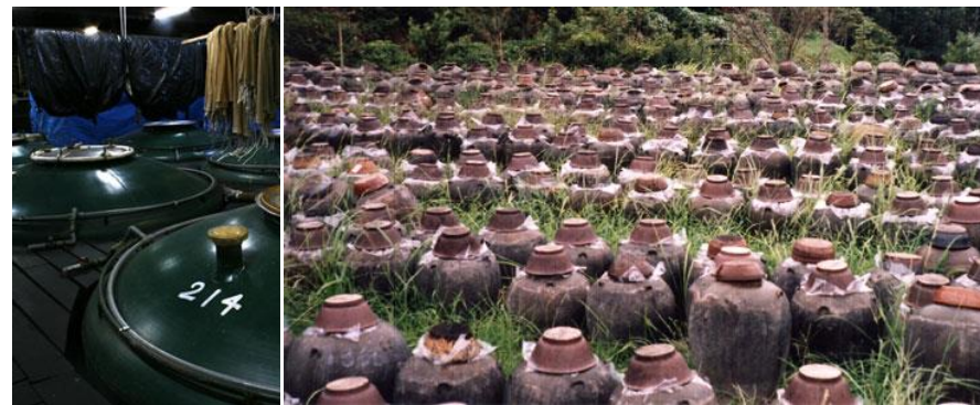
Functionalities produced by fermentation