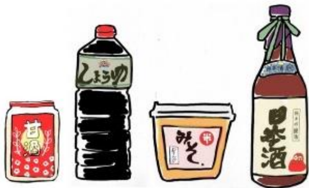
Traditional fermented foods = Slow food