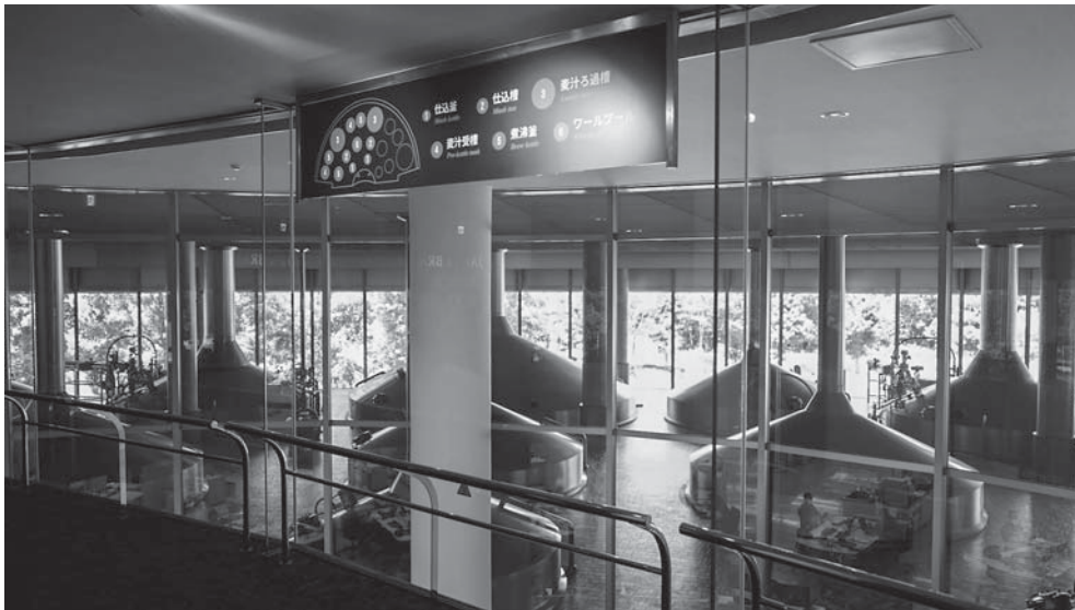
アサヒビール株式会社 茨城工場

の企業見学が可能になればそれに越したことはありませんが、難しい状況が続く可能性もあるので、今後も何かしらの工夫をしながら産官学の繋がりを形成していければと思います。