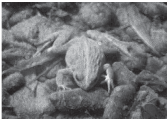
図1. 水中に潜むサドガエル