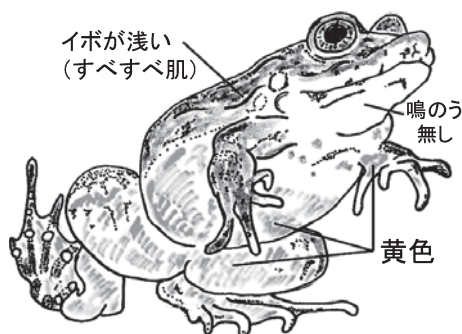
図3. サドガエルの形態学的特徴

もうひとつは、佐渡島固有種という点にある。今後、脊椎動物で他の固有種が見つかる可能性は残されている