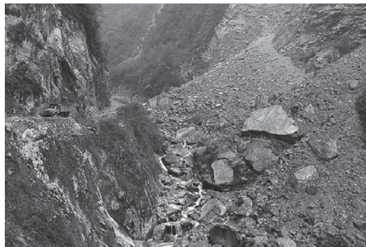
図1. 中国四川省のリン鉱石採掘現場 50)

リン鉱石の採掘現場では、排ガス、表土の攪乱や鉱山廃水による水質の汚濁などの環境問題が発生している(図1)。石油などと同様に、リン鉱石もまた品質がよく