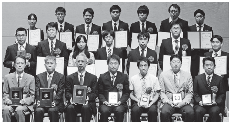
2019年度学会各賞受賞者(敬称略)

ここで簡単に日程を振り返りますと、まず初日16日は午前岡山大学創立五十周年記念館で名誉会員・功労会員推戴式、各賞の授賞式、続いて、学会賞、功績賞、技術賞の受賞講演が行われ、ランチョンセミナーを挟んで、午後には奨励賞とアジア若手賞の受賞講演、6件のシンポジウムそして一般講演が行われました。特に若手会員が企画したシンポジウムでは立ち見も出るほど盛況でした。18時30分から岡山ロイヤルホテルにて開催した懇親会には当日参