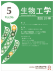
遺伝学の確立 (エンドウ)