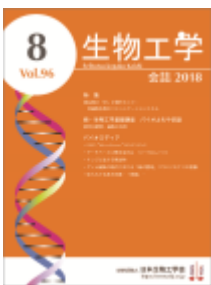
ワトソン・クリック