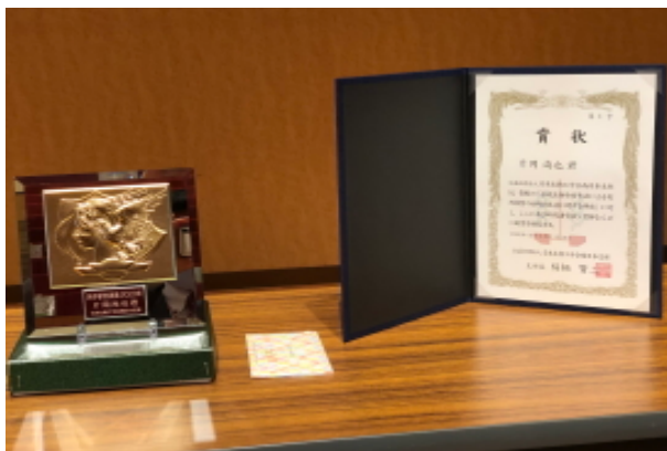
西日本支部若手研究者賞の賞状と楯